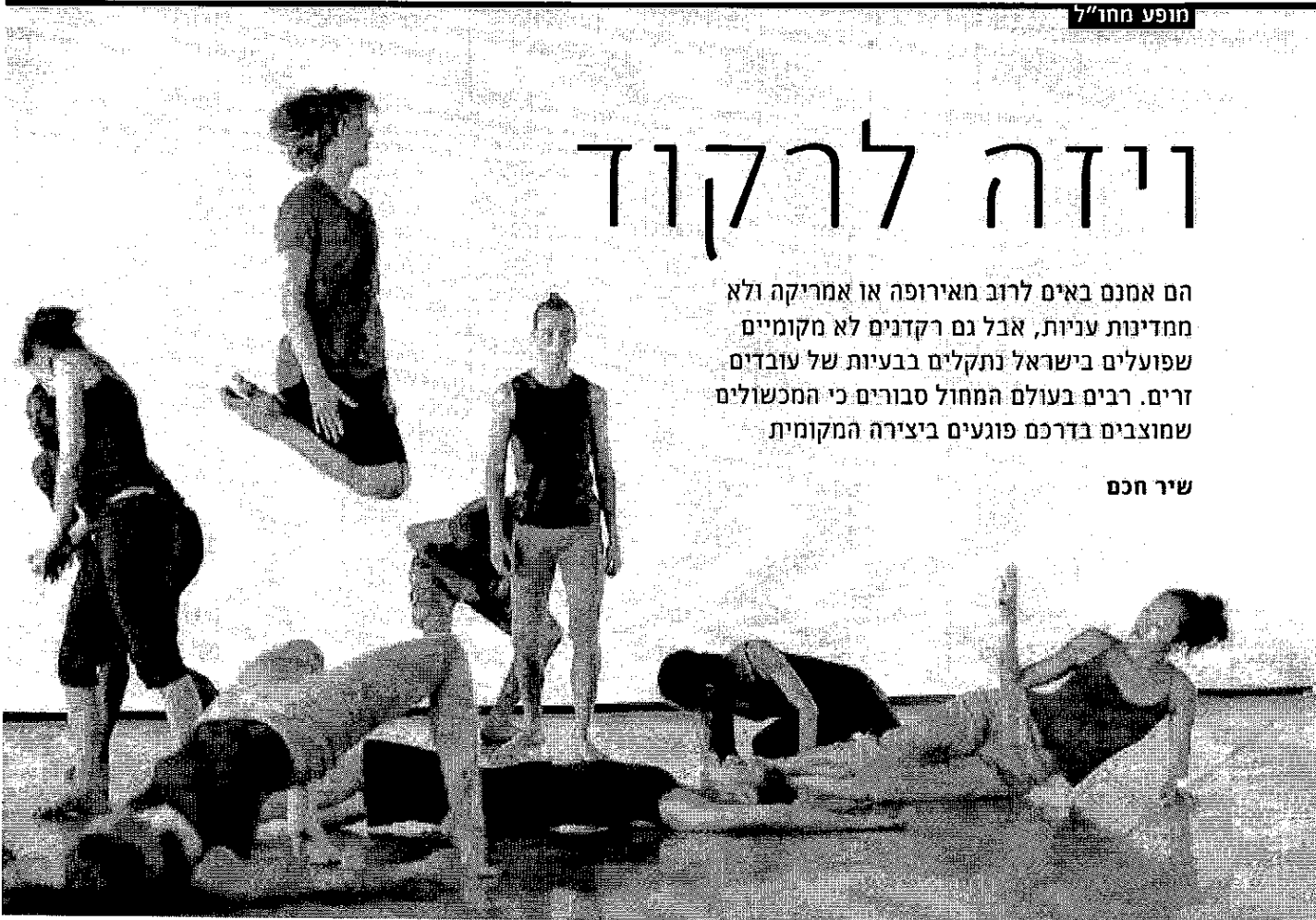
להקה בת שבע. כדי לרקוד בישראל רצוי להיות יהודי או בן זוגו

לדמיין עצמם רוקדים בלהקה אחרת. בלהקות "ורטיגו", הקיבוצית וזו של פינטו ופולק, למי של, מספרים כי מעולם לא נתקלו בבעיות ויזה של רקדנים זרים. הומן - האלמנט העקרוני ביותר בתהליכי קבלת אשורות ממשרד הפנים - הוא שעורם עוד ועוד קשיים בדרכם של רקדני בת שבע. מנקודת מבטו של נהריין, הרקדני הללו אינם רק מבצעים מיומנים בני ההל"פ, אלא נכטים חד פעמיים המעוצבים ברמותו והמגלמים כגופם את יצירתו, הנלמרת בלהקות ובבתי ספר בכל העולם.